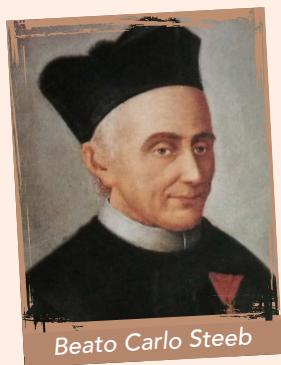
Beato Carlo Steeb