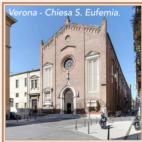
Verona - Chiesa S. Eufemia.