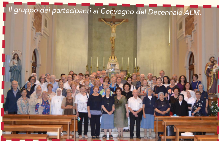
Il gruppo dei partecipanti al Convegno del Decennale ALM.

assunzione di responsabilità davanti al mondo. Allora festeggiare i primi dieci anni ALM e allo stesso tempo eleggerne il nuovo direttivo, è stato davvero una grazia; tanti laici e sorelle della Misericordia hanno promosso e operato perché l'associazione nascesse, altrettanti laici e sorelle stanno continuando l'opera, dandole sempre maggior vigore e maggior ampiezza, sempre