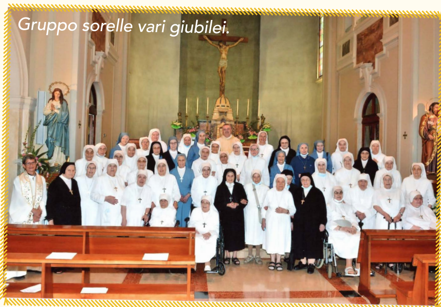
Gruppo sorelle vari giubilei.

Esplode la gioia di un lungo cammino di fedeltà ricevuta e donata in un servizio d'amore tra i "poveri e bisognosi di aiuto". Affiorano alla nostra mente, ma più ancora al nostro cuore tanti malati, tanti bambini, tante famiglie, tanti giovani, tante parrocchie, tante realtà e situazioni che abbiamo incontrato, accolto, consolato, aiutato. Grazie Signore, tutto è grazia!