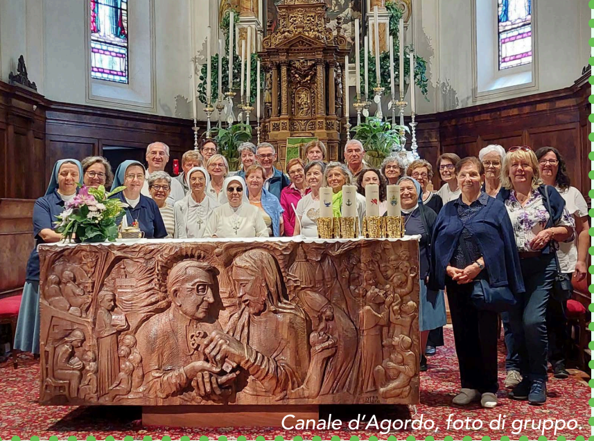
Canale d'Agordo, foto di gruppo.

realità voluta dalla Diocesi per offrire aiuto alle famiglie in difficoltà. Le attività svolte, i servizi offerti, l'impegno di tanti volontari hanno messo in evidenza come il servizio, guidato dallo Spirito Santo e svolto come operai della messe del Signore, porta a vivere la propria vocazione da affidati, per un progetto molto più grande che il Padre buono tesse con la vita di ogni persona.