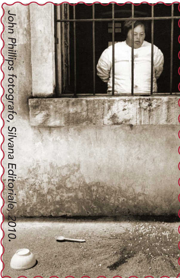
John Phillips fotografo, Silvana Editoriale, 2010.

La pazza pericolosa è chiusa, nuda, nella celletta di sicurezza, sopra un po' di paglia. Vediamo sr. Clarissa china su di lei, amorosa più che una mamma , mentre la pulisce e poi la imbecca, tentando di schiudere quei denti che si inchiodano, parlando di amore. L'occhio sinistramente vuoto dell'ammalata è immobile. Poi si sente il tonfo di uno schiaffo sonoro mentre la tazza è volata in aria e il contenuto ha imbrattato la povera suora. Povera? Macché! Sr. Clarissa abbraccia la sua feritrice e le porge