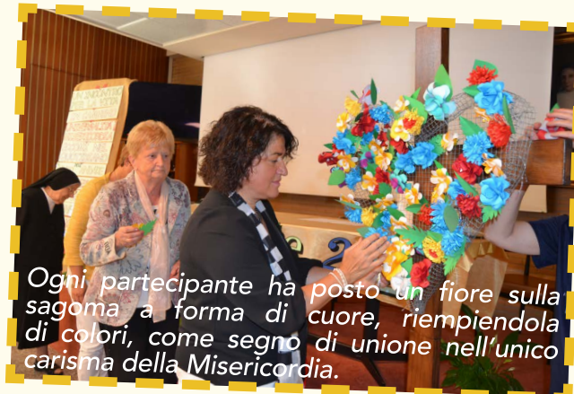
Ogni partecipante ha posto un fiore sulla sagoma a forma di cuore, riempiendola di colori, come segno di unione nell'unico carisma della Misericordia.

Il desiderio centrale è stato quello di mettere l'accento sulla crescita e il cammino che ognuno di noi si sente chiamato a fare come laico che accoglie il carisma della Misericordia come un dono da vivere nella propria quotidianità. Ecco quindi il coinvolgimento di tutte le fraternità nel chiedere loro qualche testimonianza in merito. Proprio per sottolineare che, se l'associazione cammina, è perché ogni singolo laico e ogni singola fraternità, cresce e cammina offrendo in gratuità il proprio essere laici della misericordia, secondo l'esempio dei beati don Carlo e madre Vincenza.