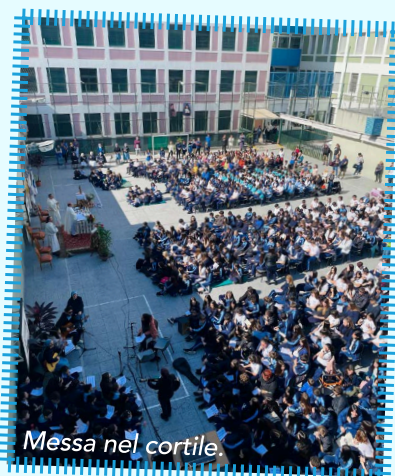
Messa nel cortile

Oggi la scuola gode della presenza di 1.800 alunni , 250 tra insegnanti, personale amministrativo e non. Tutti i giorni si respira la giovinezza di Dio manifestata dagli alunni dai 2 ai 18 anni. Bello sapersi strumenti nelle mani di Dio per educare nella e alla Misericordia, alla tenerezza, alla benevolenza, al perdono, a guardare l'altro con gli occhi di Dio.