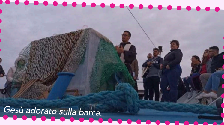
Gesù adorato sulla barca.

Il pomeriggio ci ha visti partecipi di un'esperienza davvero bella... Ci siamo ritrovati al porto dove ad attenderci c'era un peschereccio... Saliti a bordo ci aspettava qualcosa di unico e di emozionante... l'Adorazione Eucaristica... Parola di Dio e canti , ma anche piccoli significativi gesti, come aprire le mani e lasciarci toccare dall'ambiente circostante, come assaporare il profumo del mare, la brezza lieve del vento, il canto dei gabbiani ecc. oppure pregare chiedendo al Signore che ci insegni ad essere più attenti a chi abbiamo vicino... una location semplice e suggestiva che ci ha condotti a 2000 anni fa, quando Gesù parlava alle folle dalla barca di Pietro, a ricordarci che tutti siamo sulla stessa barca e il Signore anche oggi continua a parlare al nostro cuore e a rivelarci il Suo amore tenero e compassionevole per ogni suo figlio.