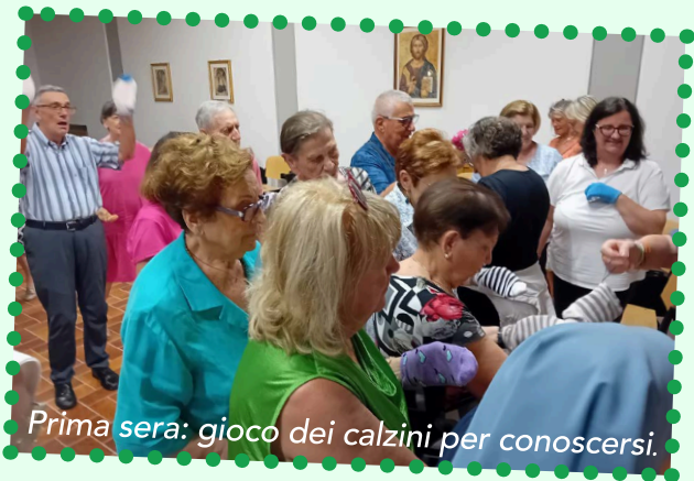
Prima sera: gioco dei calzini per conoscersi.