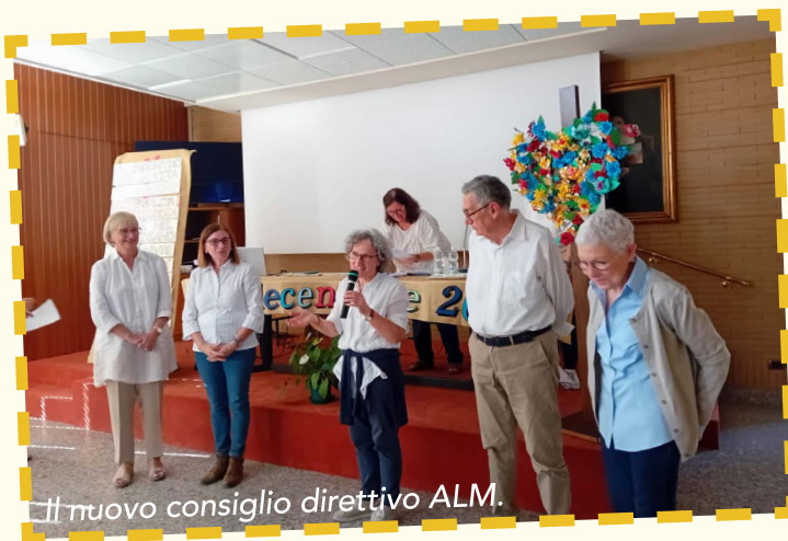
Il nuovo consiglio direttivo ALM.

mossi dallo Spirito Santo che illumina e dà forza.