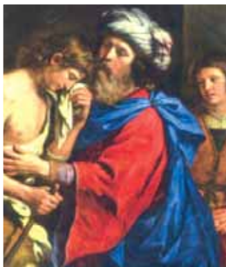
Il ritorno del figlio prodigo, tela del Guercino (1951).