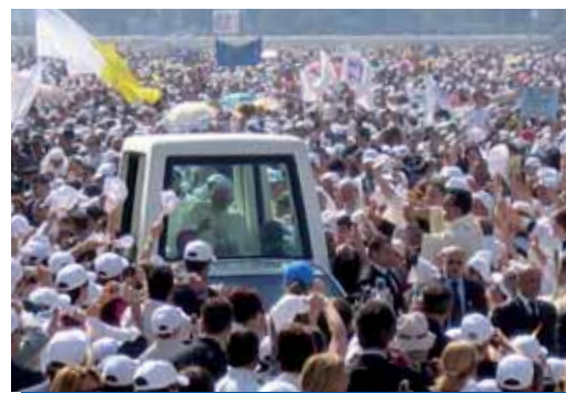
Con gioia e disponibilità una grande folla ha accolto il Papa ed ha ascoltato la sua parola.