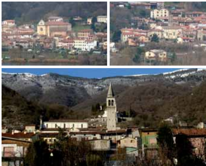
Lago - Revine: Una profonda sintonia permane fra la gente di questi luoghi e le Sorelle della Misericordia.