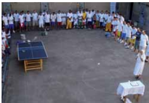
Visita ai carcerati.

taria e pastorale che abbiamo vissuto è stata molto incisiva nelle nostre vite e nella vita di tante persone che abbiamo potuto servire e aiutare.