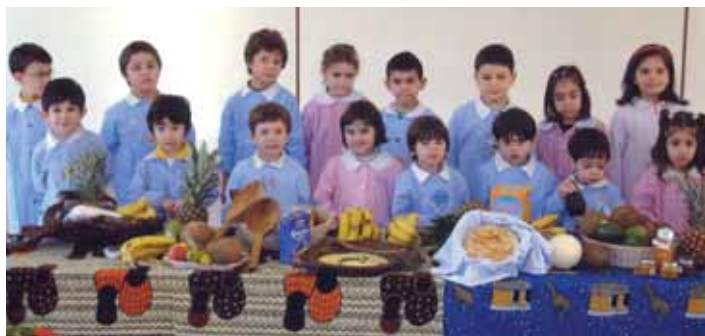
Scuola "Sacro Cuore" di Terralba.