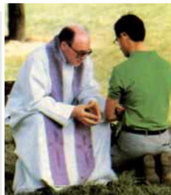
Sacramento della riconciliazione.

Dio, «ricco di misericordia», come il padre della parabola evangelica, non chiude il cuore a nessuno dei suoi figli, ma li attende, li cerca, li raggiunge là dove il rifiuto della comunione imprigiona nell'isolamento e nella divisione, li chiama a raccogliersi intorno alla sua mensa, nella gioia della festa del perdono e della riconciliazione. Gesù, nella sua vita, annuncia e rende presente la misericordia del Padre. Egli è venuto non per condannare, ma per perdonare e salvare, per dare speranza anche nel buio più profondo della sofferenza e del peccato, per donare la vita eterna; così nel Sacramento della Penitenza, nella «medicina della confessione», l'esperienza del peccato non degenera in disperazione, ma incontra l'Amore che perdona e trasforma.