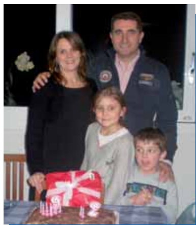
La domenica, spazio vitale per incontrare il Signore nell'Eucaristia e per rinsaldare i vincoli della famiglia.