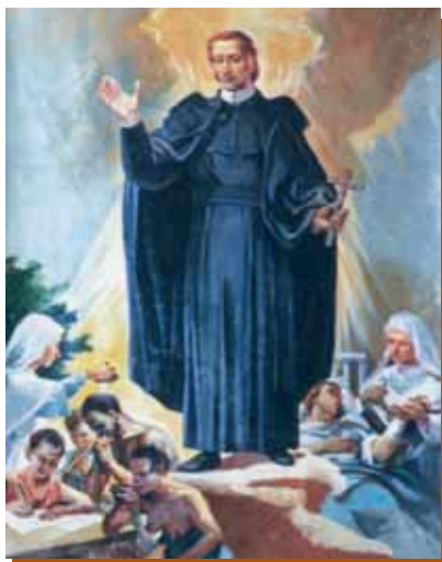
Don Carlo, che tanto ha amato la Chiesa, il 6 luglio 1975 fu da essa proclamato beato.

DON CARLO CHE AVEVA PAGATO CON IL SANGUE DEL CUORE LA SUA ADESIONE ALLA CHIESA CATTOLICA NE FU SEMPRE DEGNO FIGLIO.