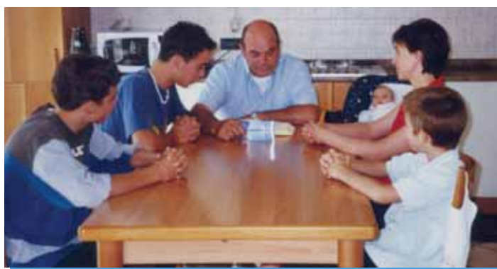
La responsabilità genitoriale porta i coniugi ad esercitare un'autentica paternità e maternità nei riguardi dei figli, diventando per loro i primi testimoni ed annunciatori della Parola.