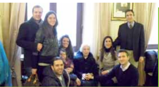
Verona Vic. Oratorio: Fede Voi.

Circondate dall'affetto di parenti e amici, oltre che dalle sorelle delle comunità, nella festa del loro centesimo compleanno.