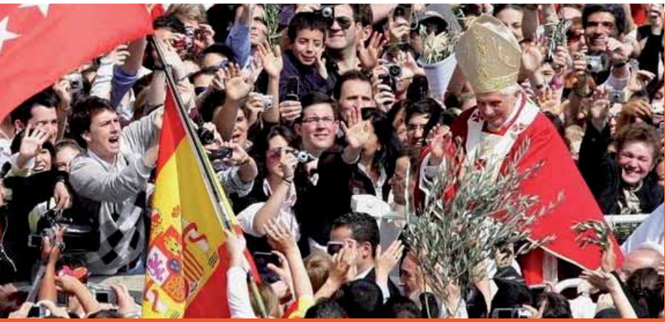
I giovani alla GMG di Madrid.

Non solo mediatica. L'hanno dimostrato i giovani come protagonisti di gigantesche manifestazioni; e lo sono per l'attenzione che la Chiesa sta loro riservando