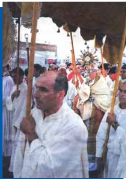
Ancona: la processione eucaristica guidata dall'arcivescovo Marini.

Un impegno che ha coinvolto le varie comunità in mesi di lavoro non può essere dimenticato o ricordato solo per la celebrazione conclusiva, sia pure molto solenne, a cui ha presenziato il Papa Benedetto XVI.