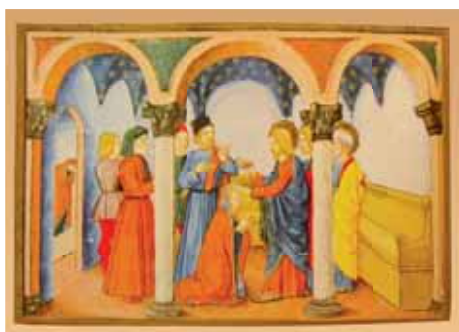
Gesù impone le mani sulla donna rattappita e la guarisce.