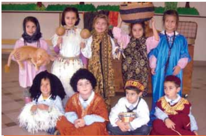
Prodotti, usi e costumi: un bagno nella Meravigliosa Africa.