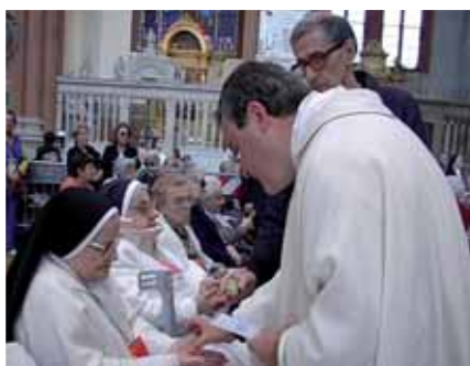
La Chiesa celebra il sacramento dell'unzione dei malati, medicina di Dio.