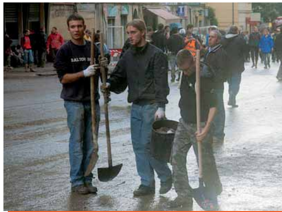
Genova - L'alluvione. Molti giovani sono scesi in campo a sperimentare l'affascinante avventura della vita nel dono di sé.

“Molti giovani [...] non aspettano altro che un adulto carico di simpatia per la vita che proponga loro senza facili moralismi e senza ipocrisie una strada per sperimentare l’affascinante avventura della vita” . Quale grande valenza educativa possono dunque avere per i ragazzi del nostro tempo quelle famiglie che si sono aperte all’accoglienza di bambini abbandonati o non riconosciuti dai propri genitori, di figli di coppie che attraversano situazioni difficili al punto di aver bisogno del sostegno di una famiglia affidataria, come pure la testimonianza di coniugi che si sono resi disponibili per l’adozione. Così come andrebbe favorita la conoscenza da parte dei giovani delle molteplici “iniziative in difesa della vita, promosse da singoli, associazioni e movimenti. È un servizio spesso silenzioso e discreto, che però può ottenere risultati prodigiosi. È un esempio dell’Italia migliore, pronta ad aiutare chiunque versa in difficoltà”. Si pensi, solo per fare un esempio, alle molteplici attività dei numerosi Centri di aiu-