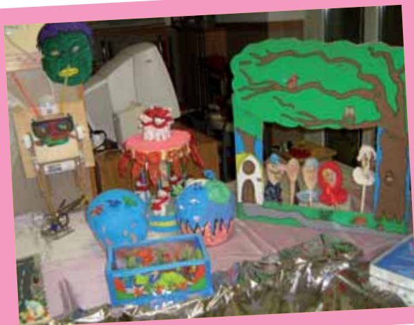
"Scuola dell'Infanzia L. Ambrosi"- Pescara.